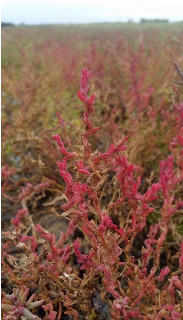
Den sjældne plante Tangurt, der er tilknyttet fugtige afgræssede områder på strandenge. Hyltemade nord for Avnø. September 2015.