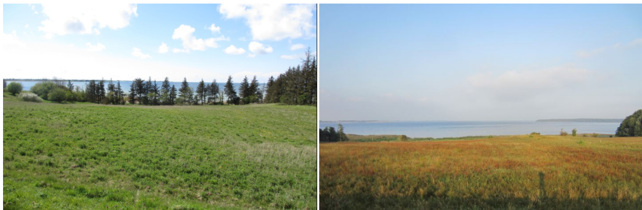
Stejle Banke før og efter den igangsatte naturpleje 2015/16.

De kommunale handleplaner for første planperiode har været gældende siden udgangen af 2012. Kommunerne har i den mellemliggende perioden arbejdet for at gennemføre den indsats, der blev beskrevet i Natura 2000-handleplanen for planperioden 2010-2015.