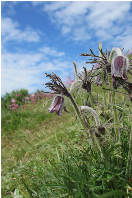
Nikkende kobjælde på Stejle Banke.