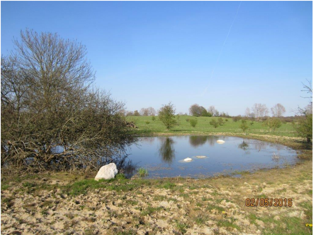
Nygravet klokkefrø vandhul på det militære øvelsesterræn øst for Næstved By.