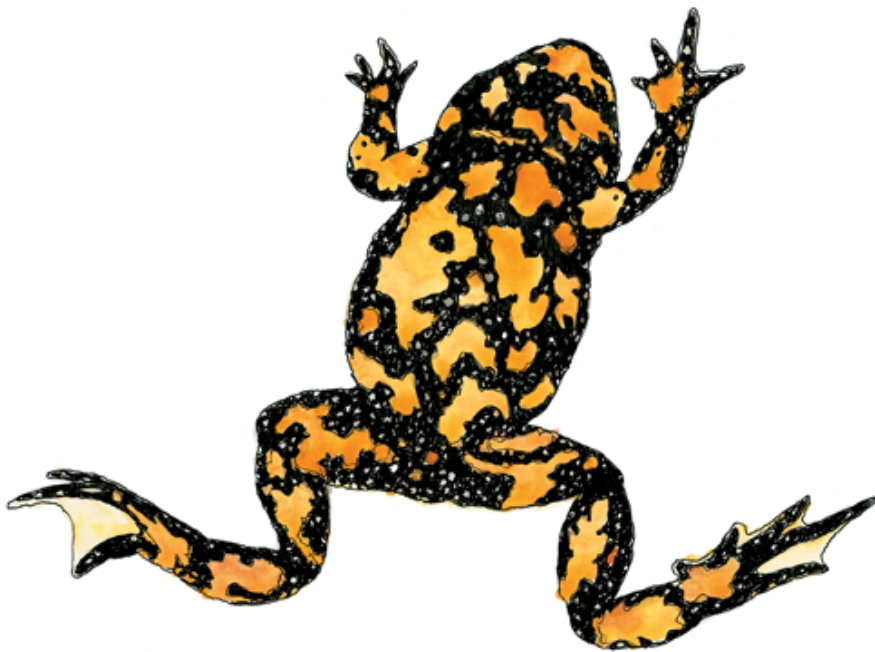
Klokkefrø (Bombina orientalis)