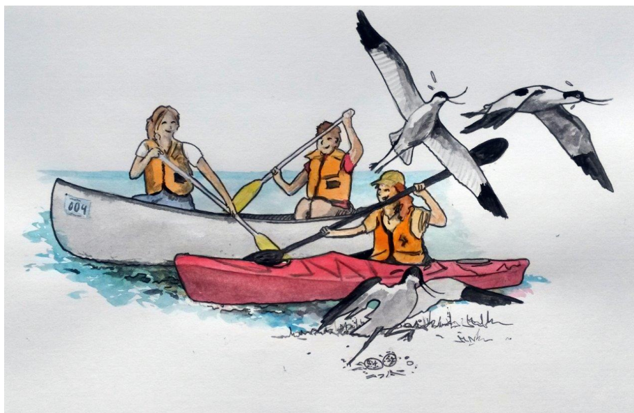
Natura 2000 – handleplanen skal bl.a. sikre at områdets ynglefugle får den nødvendige fred. Tegning Næstved Kommune