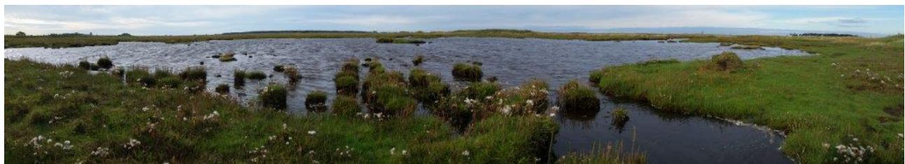
Eksempel på strandeng i en god naturtilstand både hvad angår pleje og hydrologi. Hyltemade nord for Avnø. September 2015.

Projekterne gennemføres ved frivillige aftaler, og derfor er det i mange tilfælde ikke på nuværende tidspunkt muligt at beskrive hvornår projekterne fysik bliver udført. Kommunen vil i hvert enkelt tilfælde sørge for, at relevante interessenter bliver inddraget.