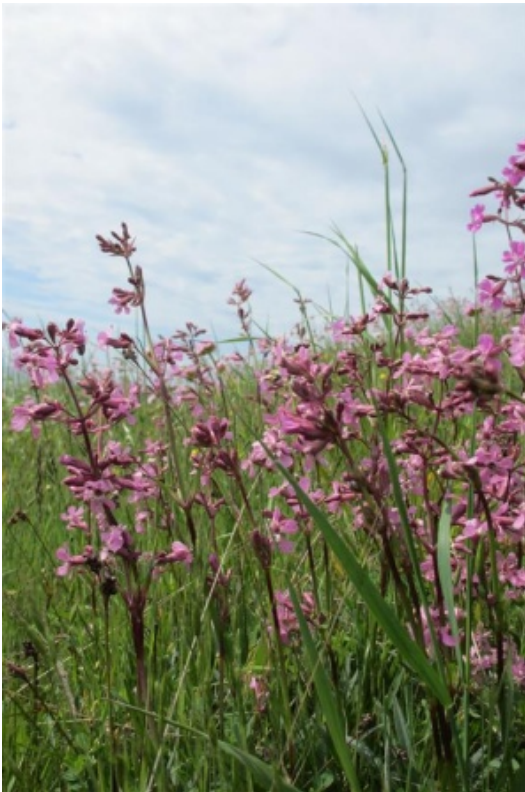
Blomstrende tjærenelliker på Stejle banke.

Det fredede område strækker sig rundt om Dybsø Fjord fra Vejlø Skov til Svinø Strand med et areal på 195 ha. Området blev fredet i 1988 for at bevare kystlandskabet som en helhed med gode levedmuligheder for det vilde plante- og dyreliv.